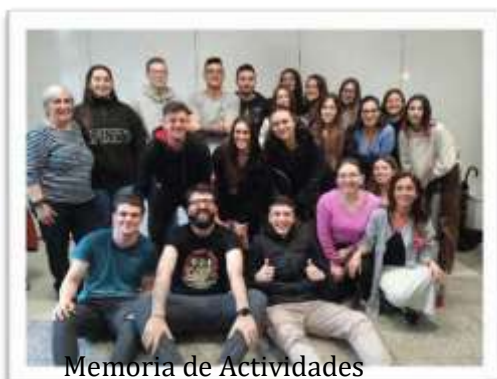
Memoria de Actividades