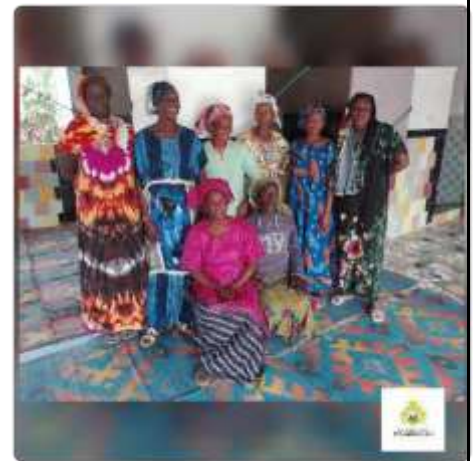
Celebración del 8 de Marzo con las madres y mujeres del barrio