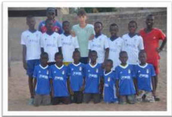
Actividades realizadas en las Colonias de Tiempo Libre