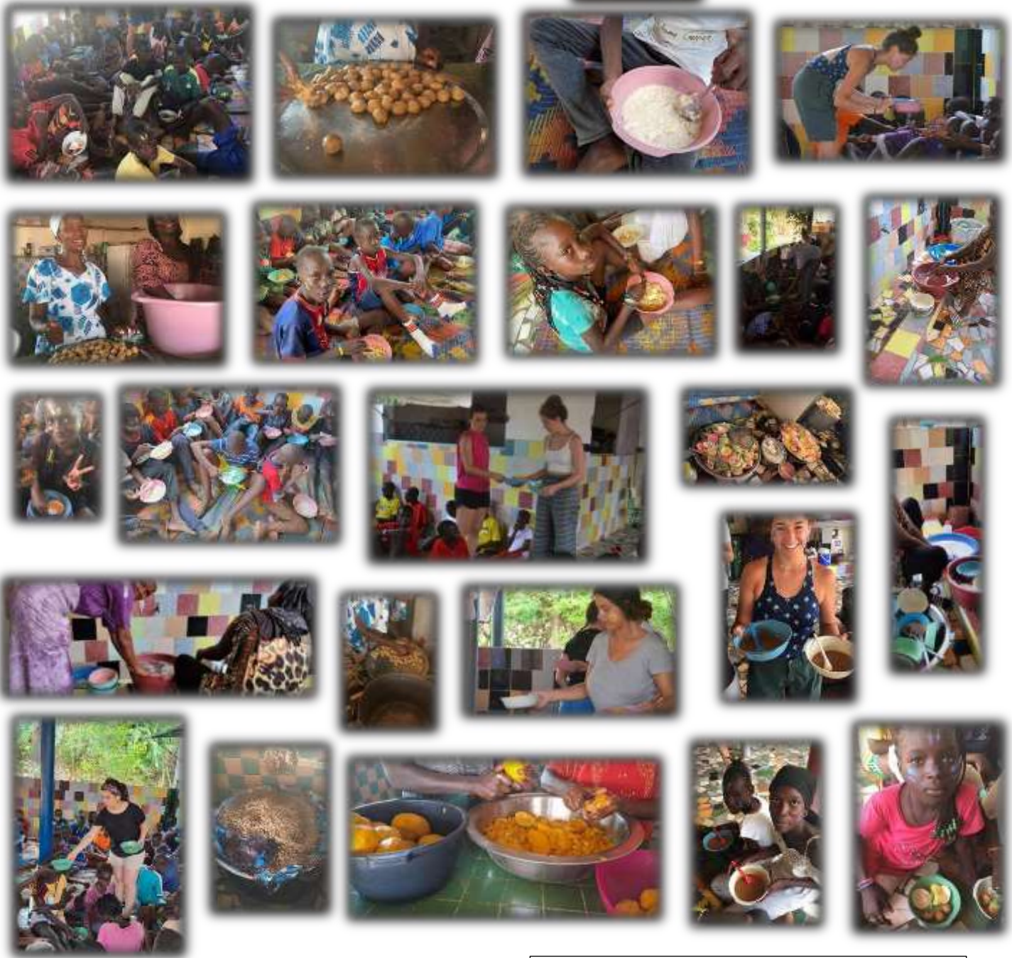
Gran recibimiento todos los días a la llegada del grupo de voluntarias y voluntarios